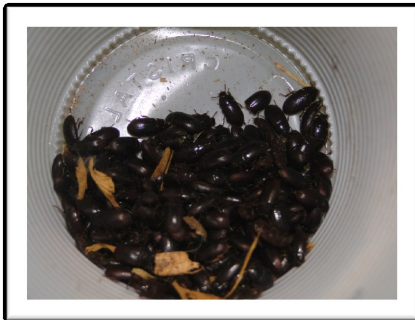
Figura 2 – Insetos adultos de Alphitobius diaperinus do grupo controle com aspecto brilhante, demonstrando a ausência da terra de Diatomáceas em sua superfície tegumentar.