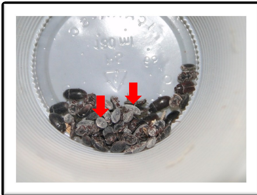
Figura 1 - Insetos adultos de Alphitobius diaperinus com Terra de Diatomáceas (TD) aderida a sua superfície cuticular demonstrando como ocorre a ação do produto.

Nota: As setas indicam os insetos com a TD aderida a sua superfície