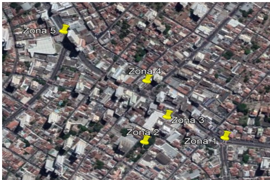
Figura 1 – Zonas de estudos na região central de Uberaba – MG