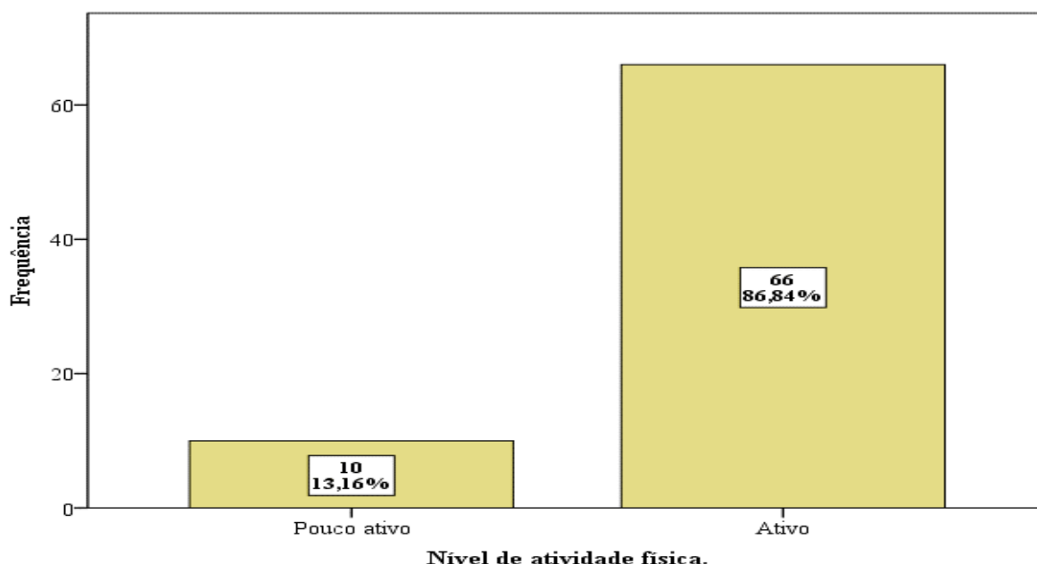
Gráfico 2 – Distribuição de frequências simples e relativas do NAF.

Houve prevalência de adolescentes ativos (86,84%) em relação aos pouco ativos (13,16%). Considerando a região geográfica do estudo, vamos de encontro a pesquisa realizado por Malta et al. (2014), na qual encontraram menos óbitos relacionados com às DCNT's na região sul do país, assim este estudo pode contribuir de maneira implícita na construção de elementos que giram em torno da conclusão de que onde há menos problemas de saúde relacionados às DCNT's, também há mais sujeitos ativos fisicamente.