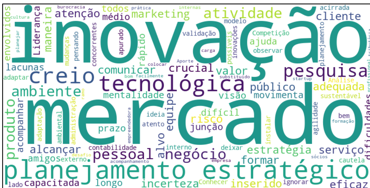
Figura 1 – Aspectos a serem observados para evitar o fracasso do indivíduo

pesquisa creio, produto, ambiente, pessoal e negócio. Com essa nuvem percebemos o tema principal das falas dos entrevistados em resposta às perguntas propostas em aspecto geral.