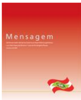
Figura 4 – Ações Governamentais - Mensagem

Os resultados obtidos revelam resultados muito positivos, considerando que foi uma das ações relevantes da SDR-Curitiba no ano de 2008, contribuindo para a consolidação de iniciativas empreendedoras na região.