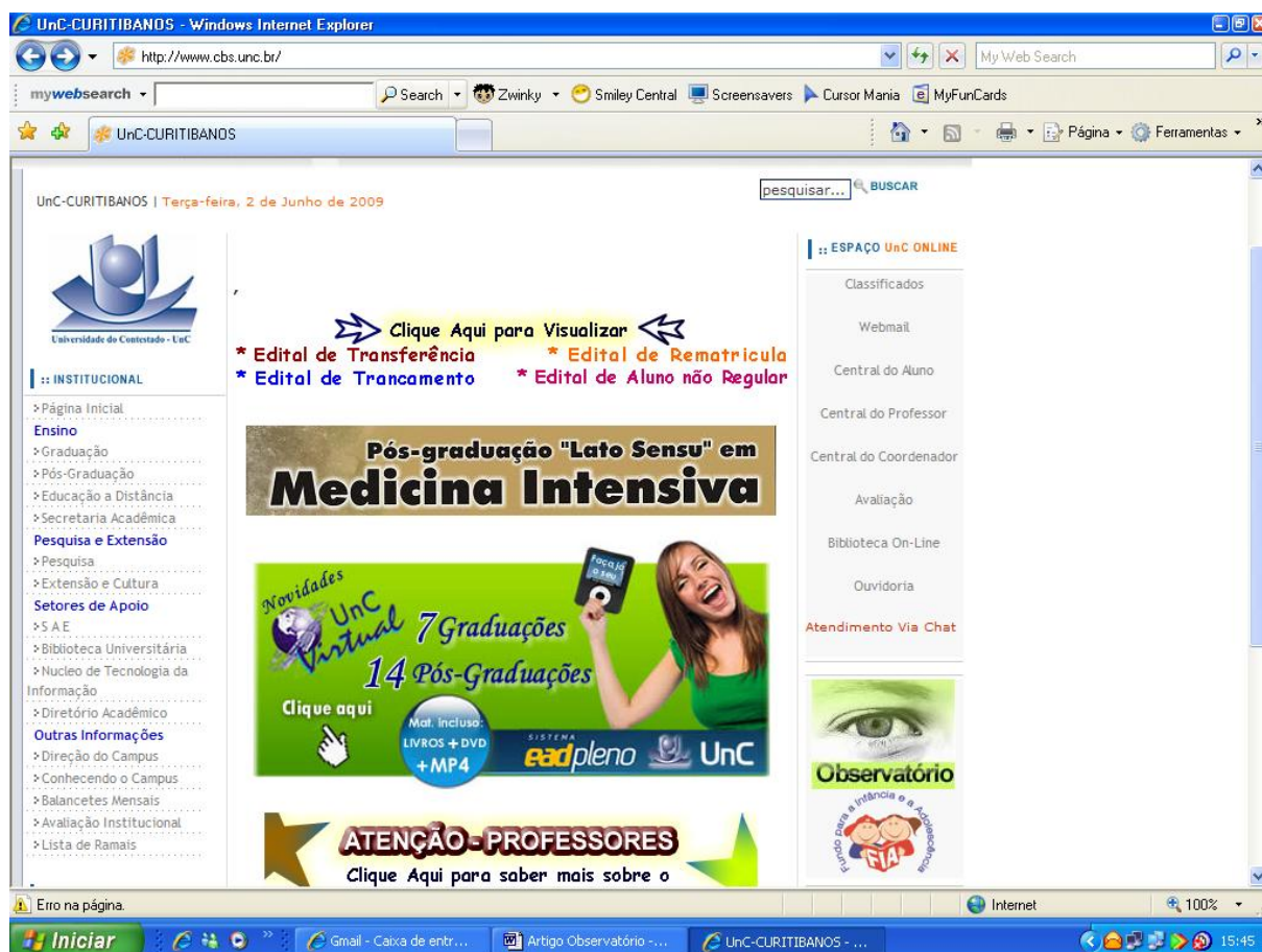
Figura 5 – O link do Observatório na Página da UnC-Curitiba

De fato, o observatório é um espaço de VISÃO, conforme denota sua imagem na web-page da Universidade do Contestado- Campus Universitário de Curitiba.